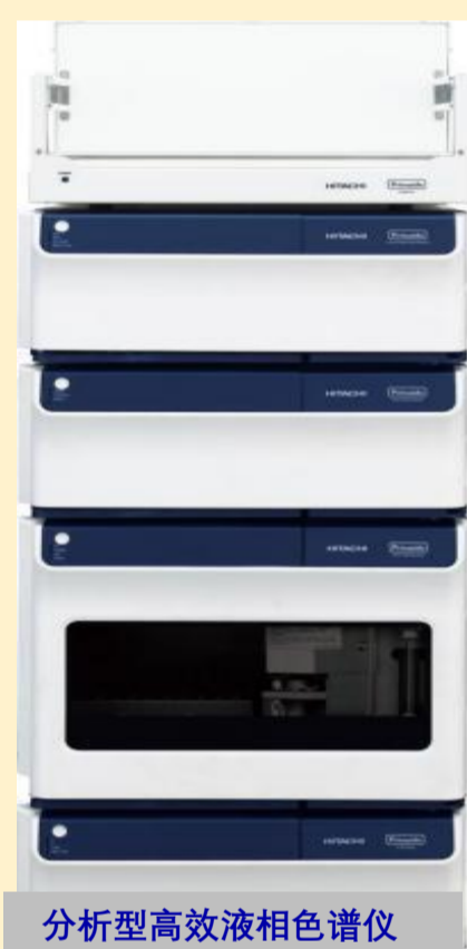
分析型高效液相色谱仪