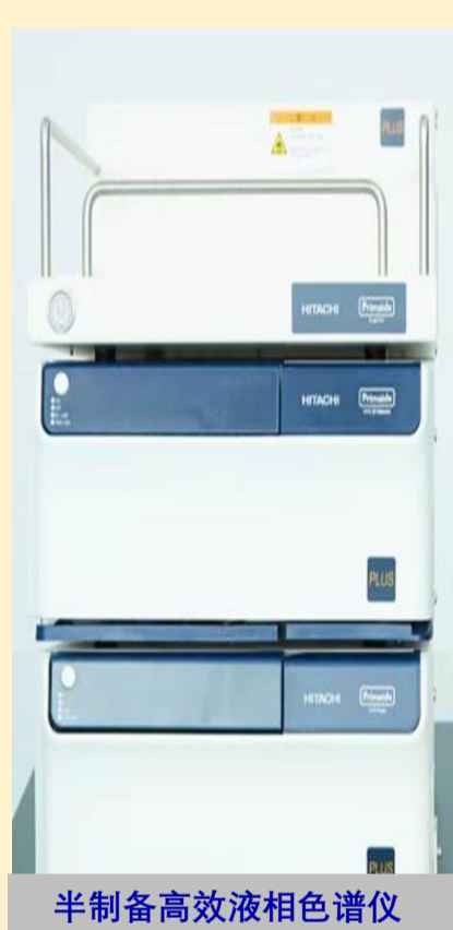
半制备高效液相色谱仪