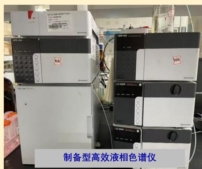
制备型高效液相色谱仪